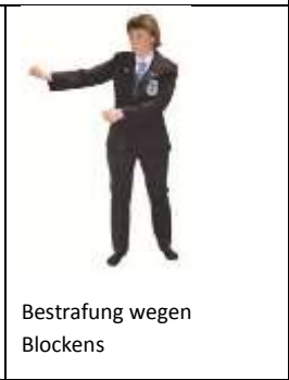
Bestrafung wegen Blockens