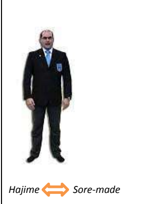
Hajime ↔ Sore-made