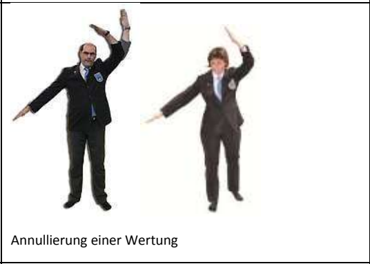
Annullierung einer Wertung