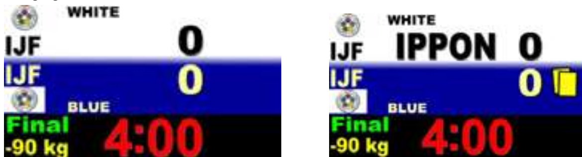
Abb. 2: Elektronische Anzeigetafel

Die Anzeigetafeln müssen die Normen der IJF bzw. dieses Dokuments erfüllen und den Kampfrichtern entsprechend zur Verfügung stehen. Manuelle Stoppuhren müssen, für den Fall des Ausfalles der elektronischen Stoppuhren, parallel zu den elektronischen Geräten verwendet werden. Manuelle Anzeigetafeln müssen in Reserve zur Verfügung stehen.