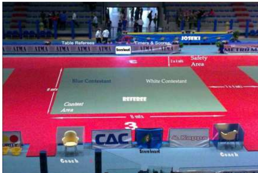
Abb. 1: Positionen der Offiziellen und der Kämpfer (weiß/blau)

Die Matten ( Tatami ) müssen eine Abmessung von 1 m x 2 m oder 1 m x 1 m haben und aus gepresstem Schaumstoff bestehen (gemäß technischer Spezifikationen der IJF). Die Oberfläche der Elemente, welche die Wettkampffläche bilden, muss eben sein und darf keine Zwischenräume aufweisen und die Elemente müssen so fixiert sein, dass sie sich nicht verschieben können. Verzahnungsmatten dürfen, mit Ausnahme der von der IJF als Wettkampfmatten zertifizierten Tatami , nicht verwendet werden.